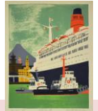
柳原良平作品 リトグラフ 「横浜港」