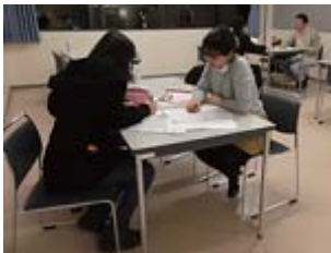
写真：みなみラウンジでの学習支援にて

このように、大学と国際機関をつなぐ役割の達成感も得ることができました。この100時間インターンシップで学んだことを生かしながら、これからは私は子どもの教育支援へ、自分ができることから貢献していきたいと考えています。今回関わった多くの方々に感謝したいと思います。本当にお世話になりました。ありがとうございました！