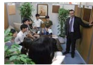
写真：ITTO 事務所訪問にて (2014年度)

普段は見る事ができない国際機関の事務所見学とそこで働く国際色豊かな職員によるセミナーと懇談を通して、緊急かつ重要な飢餓・食糧問題や気候変動など、地球規模の課題への各機関の取り組みを知ることができます。