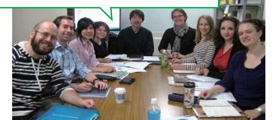
写真: 今年度のクラス風景

主に北米の日本研究の専門家や日本関係の実務家を 目指す学生・大学院生を対象に中・上級レベルの 日本語を教える IUC の活動を知る講演と、在校生 をゲストに日本語でグループディスカッション