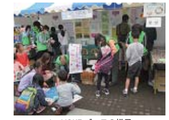
↑ 来場者のみなさまの様子