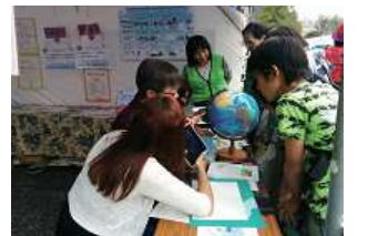
YOKEブース「外国人とのコミュニケーション体験コーナー」

<詳細> よこはま国際フェスタ2016 http://yokohama-c-festa.org/aboutus_01/