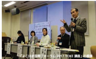
「よこはま国際フォーラム 2017 YOKE 講座」の模様

アンケートには、「難民出身の学習支援教室の卒業生で国語の先生が誕生した」という事例が喜ばしく、多様性が活かせる社会になって欲しいと願っている。「ずっと関心をもっていた内容だが、なかなか欲しい情報に出会えず、本日得た情報をものに、今後、外国につながる子どもたちの支援にかかわっていったらと思う」といった声も寄せられ、参加者の高い関心が窺えました。会場からの質問に答える形でパネルディスカッションがあり、最後に進学就労を見据えた支援とネットワークづくりの大切さを確認して終了しました。 YOKE はこれからも外国につながる子ども達とその支援者を応援していきます。ご来場いただきました皆さま、ありがとうございました！